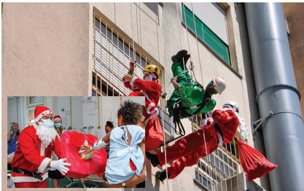
Papai Noel alegra o Natal de crianças internadas no Hospital Materno Infantil Presidente Vargas