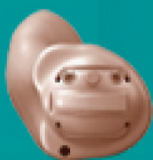
Rexton Sterling ITC

Solicite sua audiometria grátis e teste também o aparelho grátis por 7 dias. São diversos modelos e nossos especialistas estão prontos para te auxiliar respeitando todas as normas de segurança.