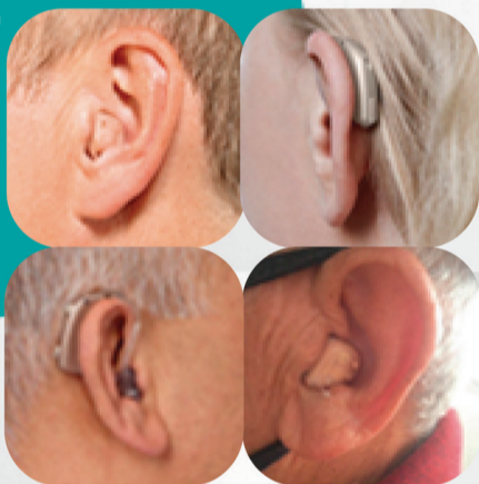
Adaptação de pacientes

Trabalhamos com toda a adaptação de nossos pacientes ao aderir seu aparelho, para trazer o maior conforto e experiência com seu aasi.