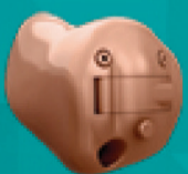
Oticon RIA ITC