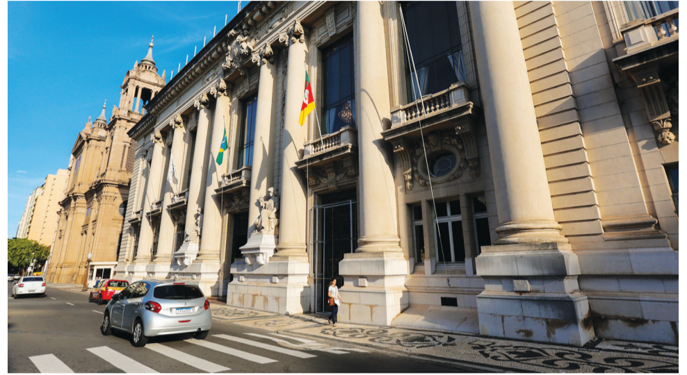
Sede do governo do estado na capital gaúcha