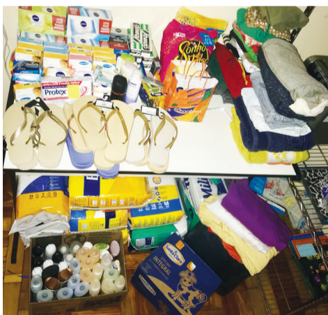
Diversos produtos foram arrecadados na ação de solidariedade que o CIPEX participou

Uma postagem nas redes sociais de um asilo em Cachoeirinha, na grande POA, em dezembro último, pedindo a ajuda da comunidade para os internos no período do Natal, desencadeou a ação de um grande grupo de pessoas com a arrecadação desde produtos de higiene, fraldas, roupas, calçados até presentes e produtos para a ceia. A