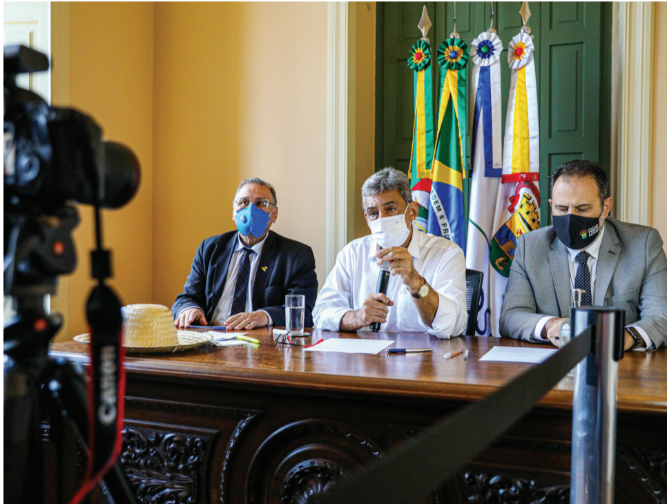
Prefeito Sebastião Mello anunciou dia 25 as novas medidas

Para preservar empregos, manter abertas as atividades econômicas e conter o avanço da contaminação da Covid-19 em Porto Alegre, o prefeito Sebastião Melo anunciou no dia 25, conjunto de medidas de restrição e enfrentamento ao coronavírus na Capital: