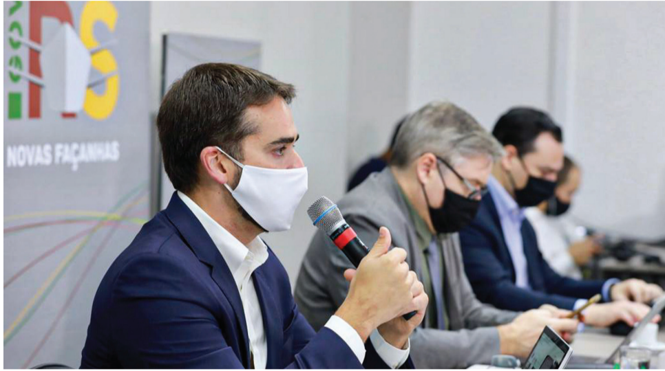
Decisão tomada no Palácio Piratini traz novas regras publicadas em decreto na última semana de fevereiro