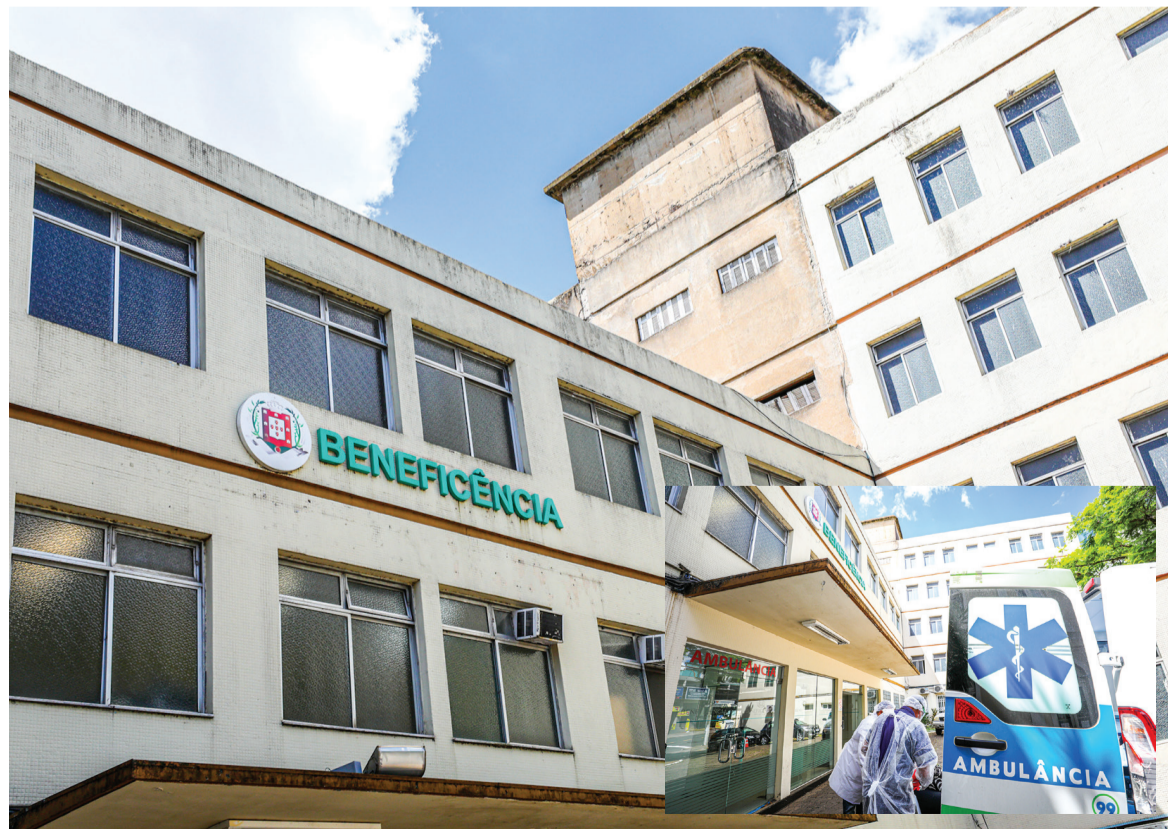
Primeiros pacientes Covid chegam ao hospital na rua Independência