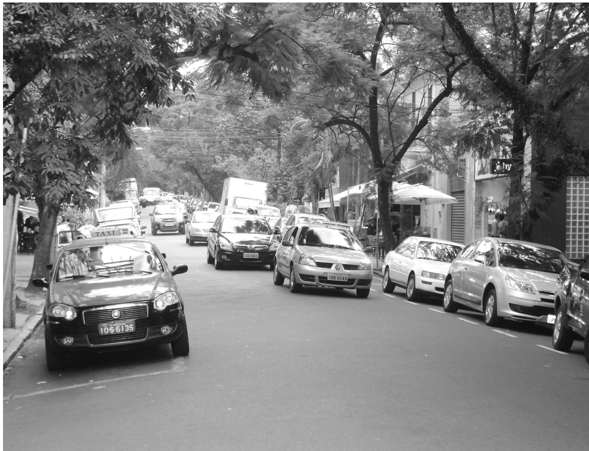
Excesso de transito na rua preocupa moradores e comerciantes do entorno