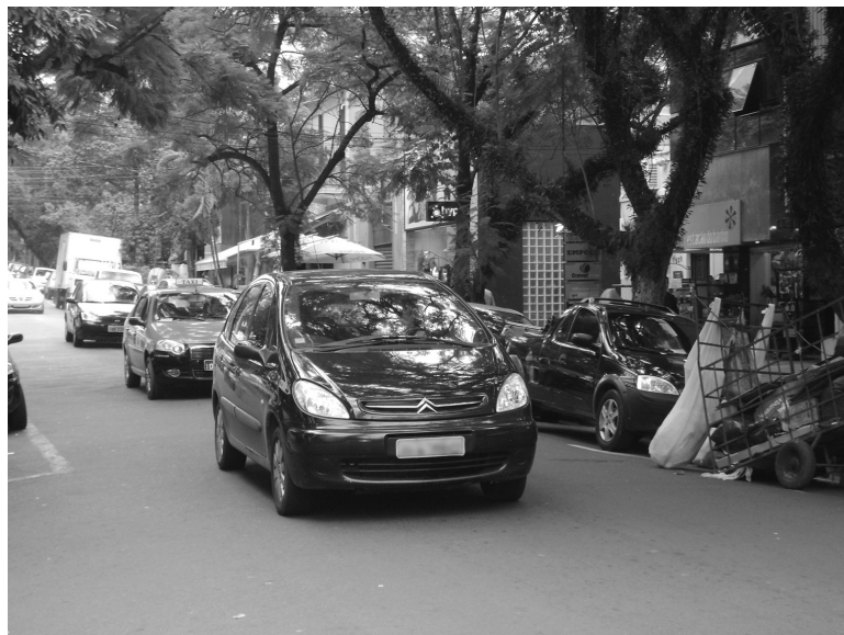
Rua estreita tem congestionamento frequente todos os dias