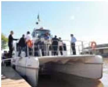
Barcos podem ser alternativa de transporte para a população