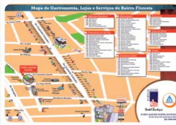
Mapa com principais pontos da região é entre aos visitantes

HI Porto Alegre Hostel Boutique (www.hostel.tur.br) Rua São Carlos, 545, Bairro Floresta - Porto Alegre Fone: 3226-5380 E-mail contato@hostel.tur.br Tarifas: R$ 45,00 a R$ 130,00.