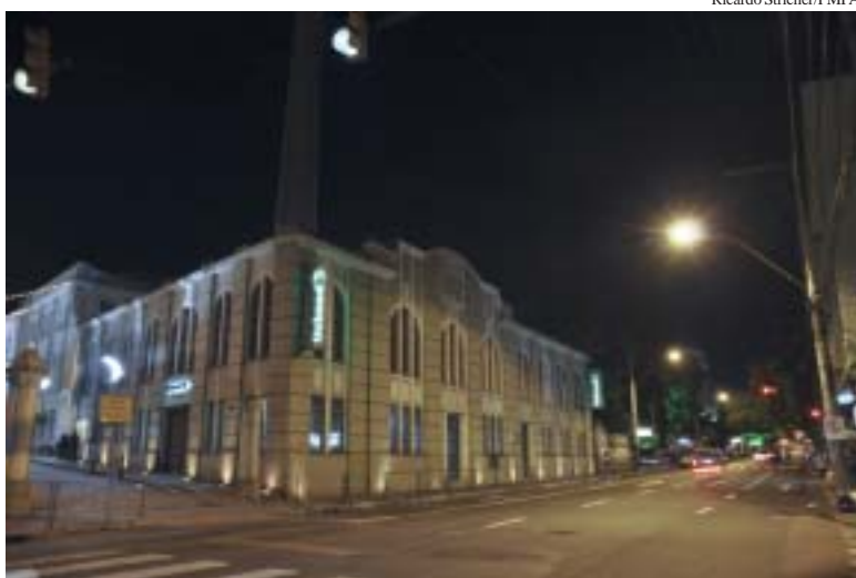
Cristóvão Colombo teve sistema de iluminação trocado há pouco tempo

Cerca de 78 mil pontos de iluminação pública já foram substituídos pela prefeitura na Capital. Com o projeto Porto Alegre + Luz aproximadamente 97% da cidade já conta com um sistema mais eficiente que ilumina 30% a mais e ainda proporciona economia. "São ruas, avenidas, praças e parques mais iluminados e, portanto, mais seguros", afirma o titular da Smov, Cássio Trogildo. O projeto está mudando a paisagem noturna da cidade com luminárias de vapor de sódio e vapor metálico, equipamentos menos poluentes e mais econômicos que os antigos, de vapor de mercúrio. "Estamos entregando um novo parque de iluminação à Capital de todos os gaúchos. As lâmpadas são mais modernas e mais eficientes, o que nos proporciona mais segurança e mais beleza noturna nas nossas ruas, avenidas, parques e praças", destaca. O projeto também contempla a renovação do sistema de ilu-