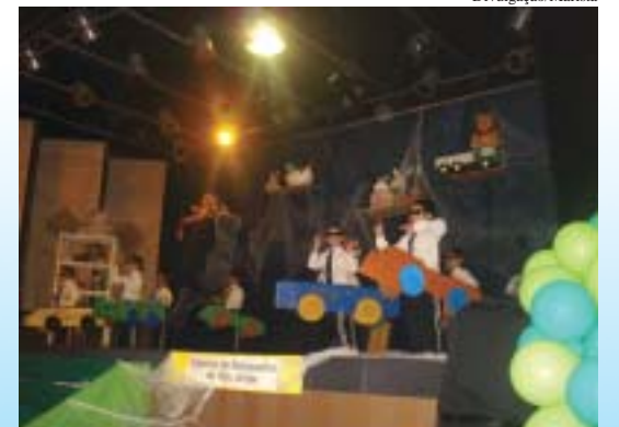
Pais e alunos do Colégio Marista São Pedro confraternizaram durante a Festa da Leitura