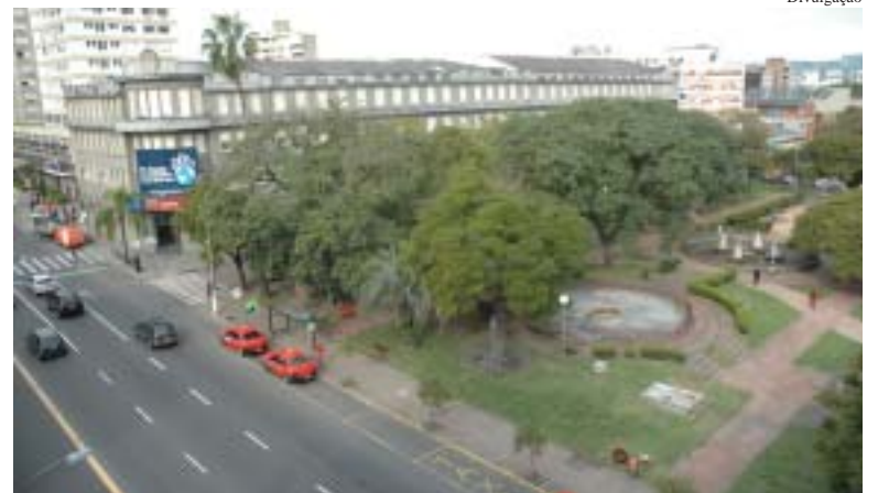
Praça está localizada na avenida Independência

No dia 10 de dezembro a partir das 20h será realizado o evento "Natal na Praça" na praça Dom Sebastião, na avenida Independência. Voltado para a comunidade do entorno e principalmente para as crianças do Hospital da Criança Santo Antônio da Santa Casa de Porto Alegre a programação terá entre outras atrações a apresentação de músicas natalinas com a Camerata Mansão Musical, Coral Associação Cultural Italiana do RS e Grupo de Flautas do Colégio Marista Rosário. A realização é da Prefeitura e Secretaria Municipal do Meio Ambiente de Porto Alegre, Museu de História da Medicina e Sindicato