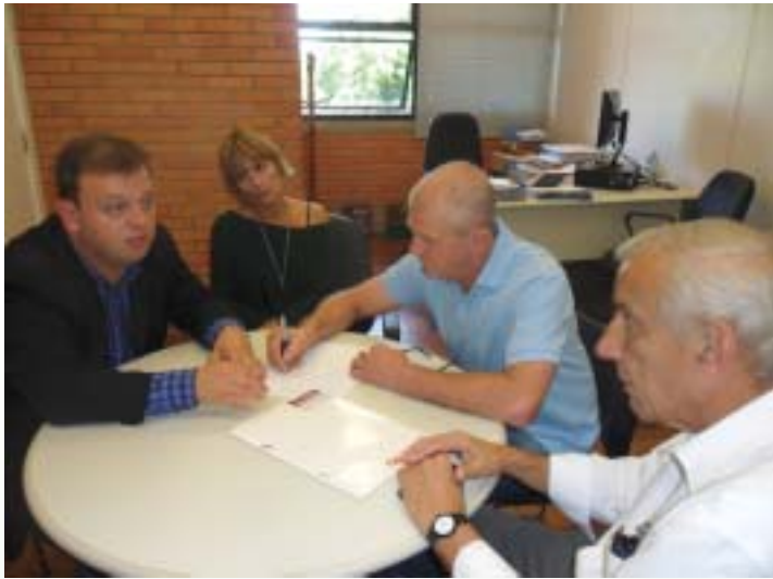
Organizadores preparam festa na Praça Dom Sebastião

Acontece no dia 10 de dezembro o Natal na Praça, projeto tão almejado pela AMABI e pelos moradores do bairro Independência. A Praça que fica em frente à Igreja da Conceição, ao lado do Colégio Rosário, terá pela primeira vez a realização de um evento natalino com o envolvimento de todas as entidades que circundam a referida praça. Este fato, junto com a recuperação do local, será a realização de um sonho idealizado pela atual diretoria da associação. A retomada do espaço pelos moradores do bairro e população, através de uma manifestação cultural pública, as vésperas do Natal, é sem dúvida um momento marcante para quem guarda belas e afetivas lembranças daquele local. Para a diretoria da AMABI a sensação é de ter conseguido um fato muito positivo para melhoria da Independência.