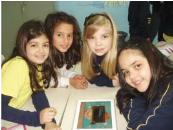
Alunos do colégio aprovaram a novidade