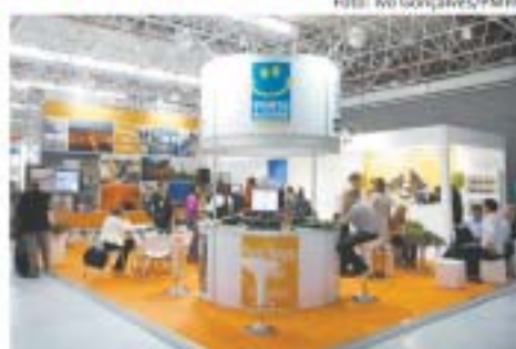
Lançamento do concurso Campus Party

O desafio tem como objetivo encontrar aplicações, tecnologias, metodologias